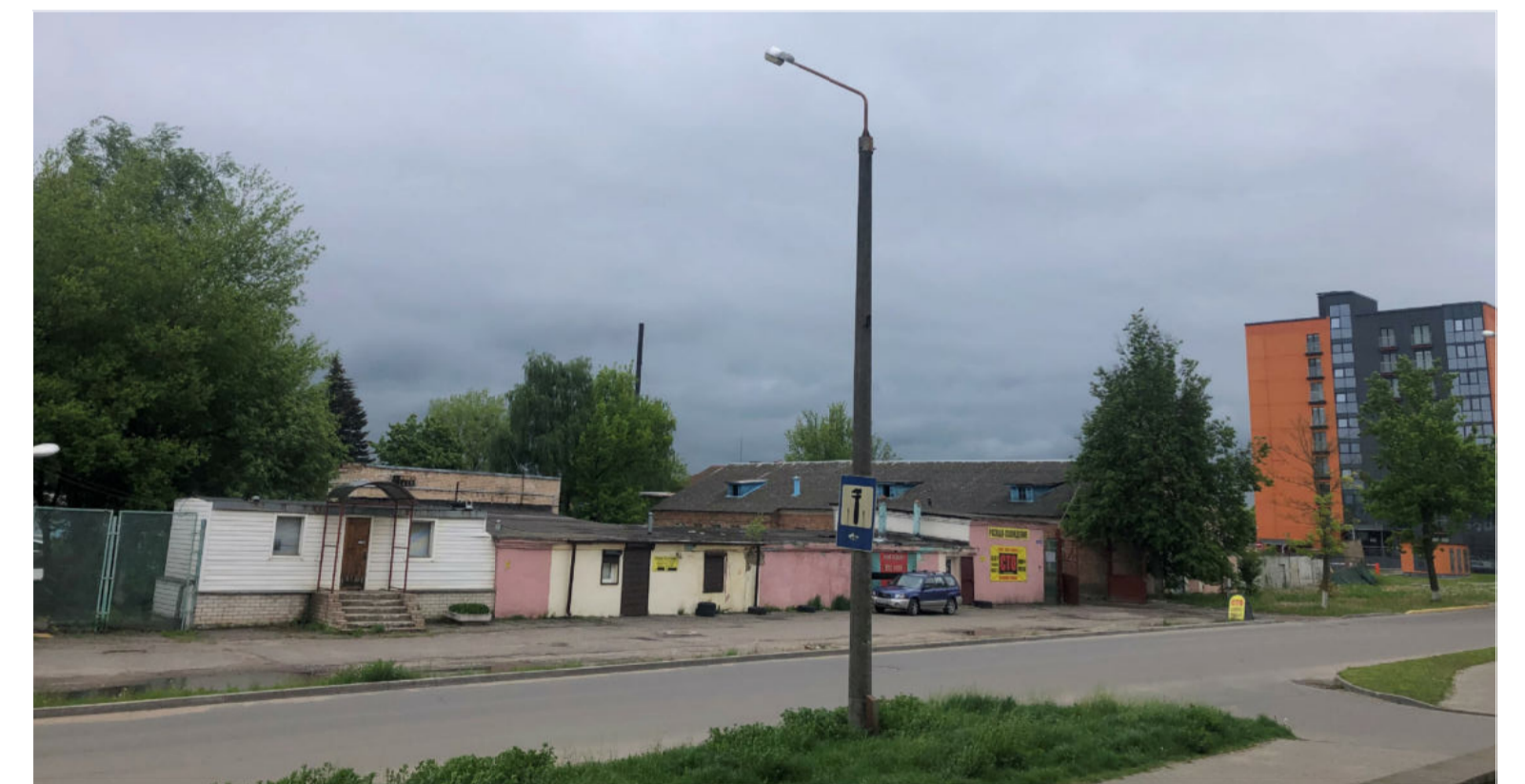
Фото проектируемого положения