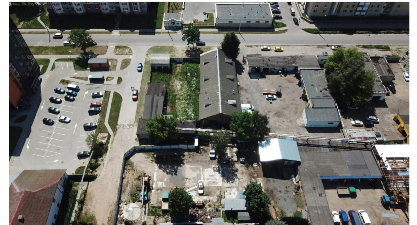
Фото проектируемого положения